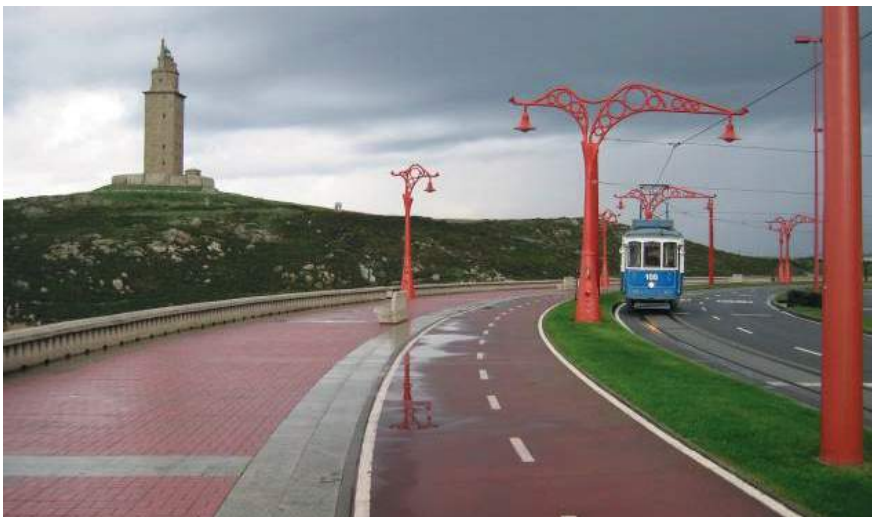
Figura 5. Paseo de Orillamar. Ing. Autores. E. Toba y E. Urcola.

Al referirse Pablo Serrano a sus "Bóvedas para el Hombre", se expresaba del siguiente modo: