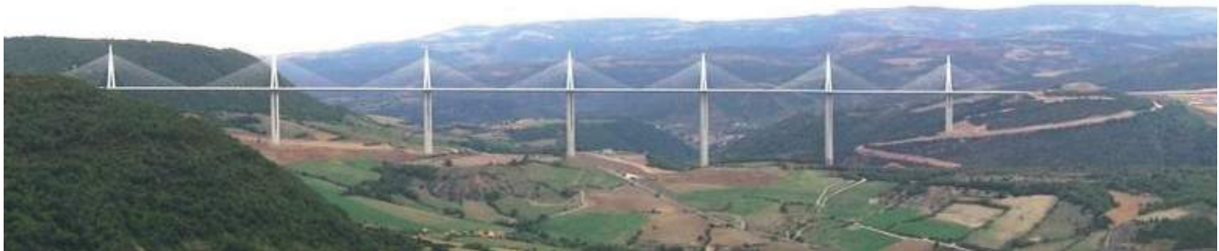
Figura 20. Viaducto de Millau. (Norman Foster, 2004)