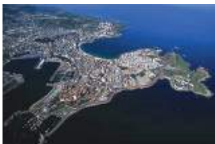
Figura 17. Paseo de Orillamar (A Coruña). Autores. E. Toba y E. Urcola. Fotografía de Xurxo Lobato, fuente colección Voz de Galicia