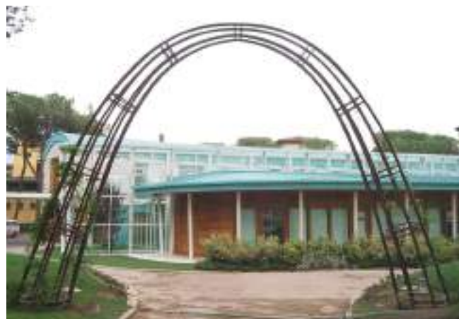
Figura 13. Bronze Gate. Pistoia. Robert Morris

Así un puente como objeto creado por el Hombre debe tener como fin el de unir las riberas separadas del territorio, librar un accidente natural o artificial, para permitir que ambas orillas las alcancen los humanos. ¿Dónde se produciría la mayor armonía en esa múltiple relación, la del puente con ambas riberas?, de acuerdo con los criterios que venimos defendiendo, en lo estricto, en lo mínimamente necesario para alcanzar el fin buscado. Entonces cada dovola trabajaría al máximo, pues habría sido diseñada para soportar el máximo esfuerzo. Su apariencia sería mínima, limpia, casi transparente. Todo lo demás sería excesivo, superfluo, soberbio en la peor de sus acepciones, ni siquiera llegaríamos a comprenderlo.