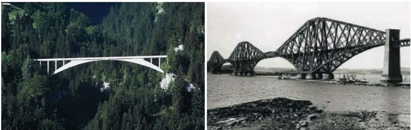
Figura 21. Salginatobel y Firth Of Fourth. (Robert Maillart, 1930) y (Benjamin Baker y John Fowler, 1890), respectivamente.