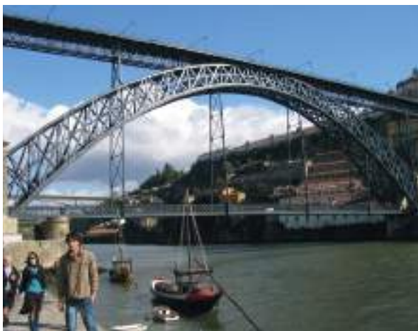
Figura 15. Puente Luis I en Porto (T. Seyrig 1886). Fotografía de E. Toba

Se trata de dotar de referentes artísticos a dos enlaces de un proyecto de refuerzo y ensanche de una carretera que incluye mejora del trazado. Tiene un desarrollo lineal a lo largo de casi un kilómetro. Discurre por zona periurbana, por lo que es muy importante la dotación de elementos estéticos, referenciales y paisajísticos, que se resuelven a base de vegetación ornamental del tipo tapizante y tratamiento escultórico del territorio de tipo "Land Art" en las intersecciones existentes.