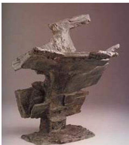
Figura 7. Boveda para el Hombre. Pablo Serrano.