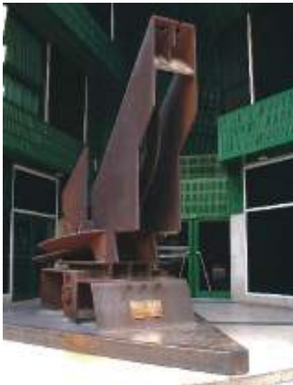
Figura 3. "El Perro" de Néstor Basterrechea

podríamos considerarle centro del Universo, pero también como envolvente de todas las rectas tangentes a aquellas, que forman ángulo recto con los radios. Los centros de curvatura serían los lugares desde donde se ejerce alguna acción o influjo sobre el Hombre, y la reacción contra ese influjo surge desde el interior de su ser, situado dicho centro en un infinito, en lo más profundo de su subconsciente, es decir muy alejado de todo su exterior y que sería a su vez el centro del microcosmos humano. El ángulo recto es el lugar de encuentro de la línea de acción de esas fuerzas de atracción y de rechazo que actúan sobre el Hombre, con aquella otra perpendicular a la anterior sobre la que discurren las que le llevan a su liberación, fugándole tangencialmente, unas veces por medio de la evasión y otras