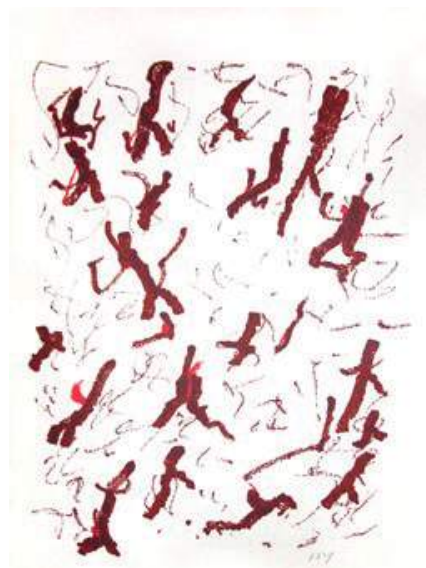
Figura 1. Muestra de la obra pictórica de Henri Michaux

<< Paisajes apacibles o desolados Paisajes de la carretera de la vida más que de la superficie de la Tierra Paisajes del Tiempo que corre lentamente, casi inmóvil y a veces como retrasado Paisajes de los jirones, de los nervios lacerados, de las "saudades" Paisajes para cubrir las llagas, el acero, la esquirra, el mal, la época, la cuerda al cuello, la movilización. Paisajes para abolir los gritos Paisajes como quien se pone una sábana sobre la cara. >>