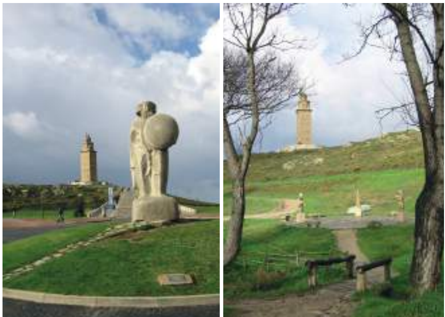
Figura 4. Breogán de Xosé Cid, y Ártabros de Arturo Andrade

No son pocas las muestras donde las diferentes obras no fueron concebidas para el espacio donde con carácter permanente o temporal, fueron ubicadas. Existe una fuerte tendencia hacia la implantación sin más preámbulos de la obra de autor, que se impone a aquella otra que fue concebida para el espacio en concreto, olvidándose del necesario diálogo (tal como sucede en el arte Minimal) entre obra, espacio circundante y ser humano. Llegando a constituir, a veces verdaderos almacenes de obra escultórica, carente en su conjunto de valor estético, al faltar la necesaria armonía entre aquellas y el espacio donde