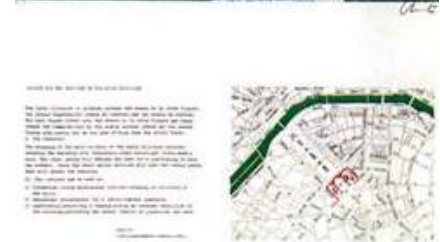
Figura 11. Proyecto para la Ecole Militaire. Christo