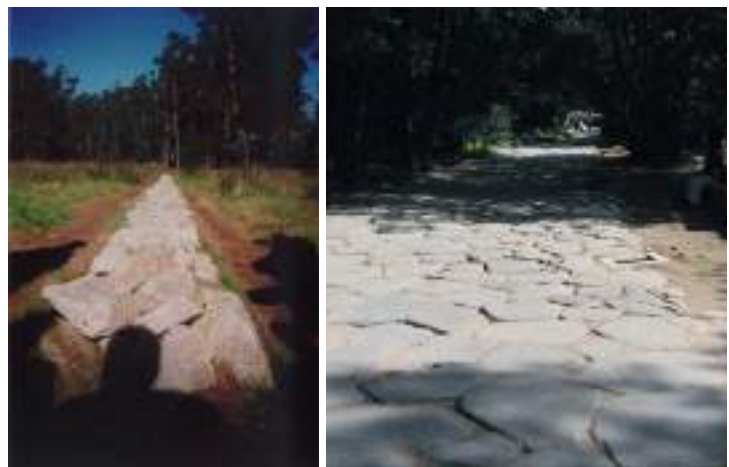
Figura 16.- Camino de Richard Long (Isla de Esculturas en el río Lérez, Pontevedra) y Calzada del Foro Romano.