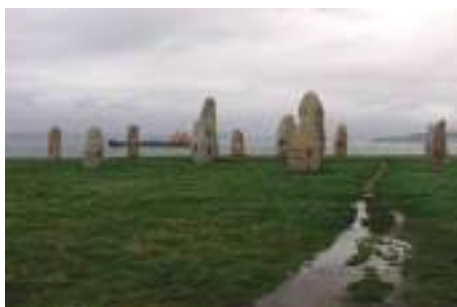
Figura 18. Parque Escultórico de la Torre De Hércules (A Coruña). Menhires de Manolo Paz, y Rosa dos Ventos de X. Correa. Autores. E. Toba y E. Urcola