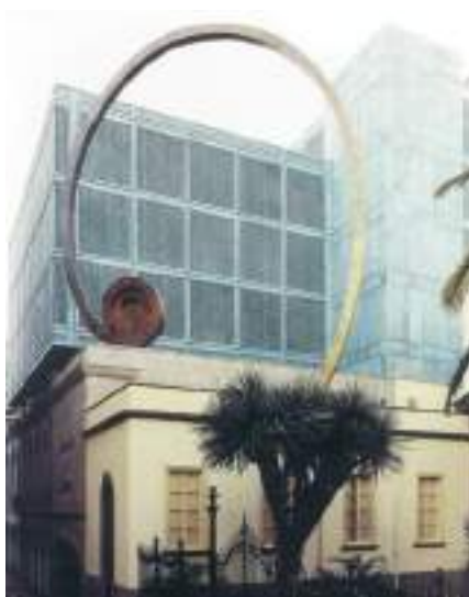
Figura 19. Espiral (M. Chirino, 1999) y Clotoides en AP-9