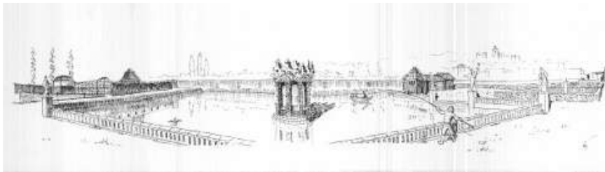
Figura 14. Jardín de Lastanosa. Huesca

Esa aproximación al modo utilitario y seguramente sin perseguir como objetivo el acercamiento al Arte y la Belleza, ha sido recibida como legado en la obra histórica o patrimonial, como son las calzadas romanas.