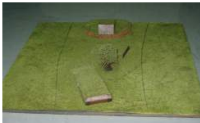
Figura 23. Acceso oeste a Burela. Maqueta de José Basterrechea

inconsistente, quedándose únicamente con el de Utilidad, e ignorando la compatibilidad entre ambos.