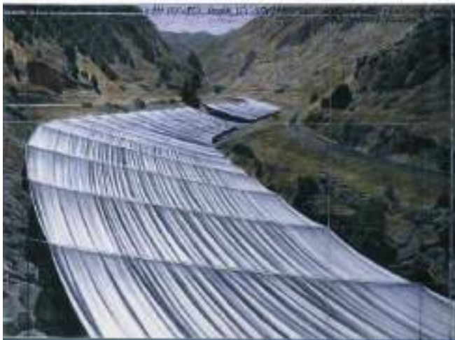
Figura 9. Over the River (Río Arkansas). Christo