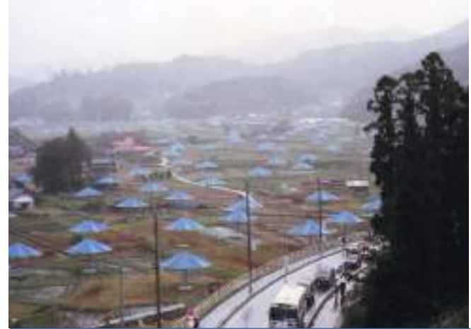
Figura 10. Pont Neuf. París, Christo, y Jeanne Claude y Umbrellas (Japón), Christo y Jeanne Claude.

pueda apartarla de aquella manifestación. Pero además, porque no siempre la obra de ingeniería establece entre sus paradigmas, el objetivo de belleza, prevaleciendo generalmente el logro de utilidad.