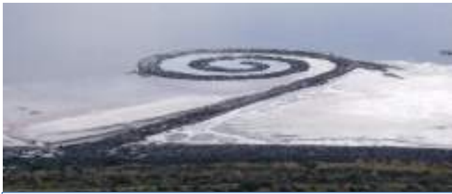
Figura 8. Spiral Jetty, de Robert Smithson