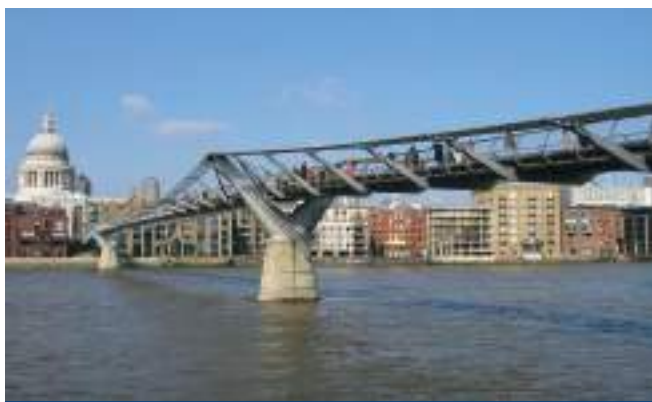
Figura 22. Millennium Bridge. Río Támesis (N. Foster, 2000).