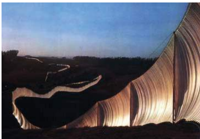
Figura 12. The Runing Fence. (California). Christo